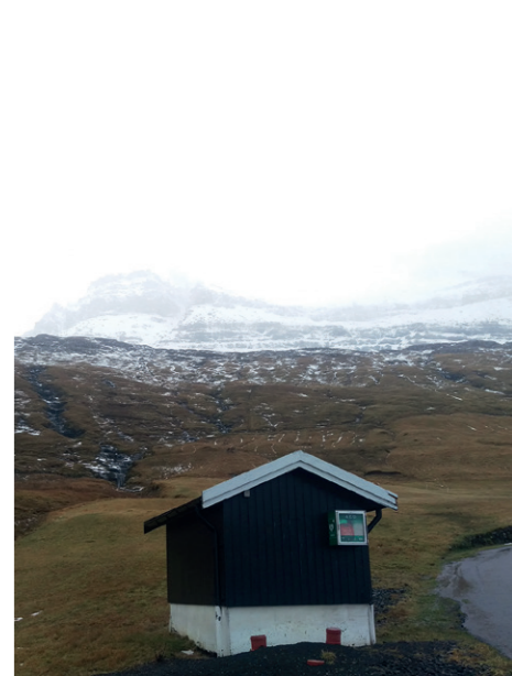
Hjartastartari verður nú settur upp í øllum byggunum.