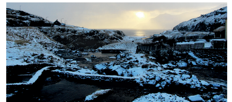
Vetrarmynd úr Leynum.