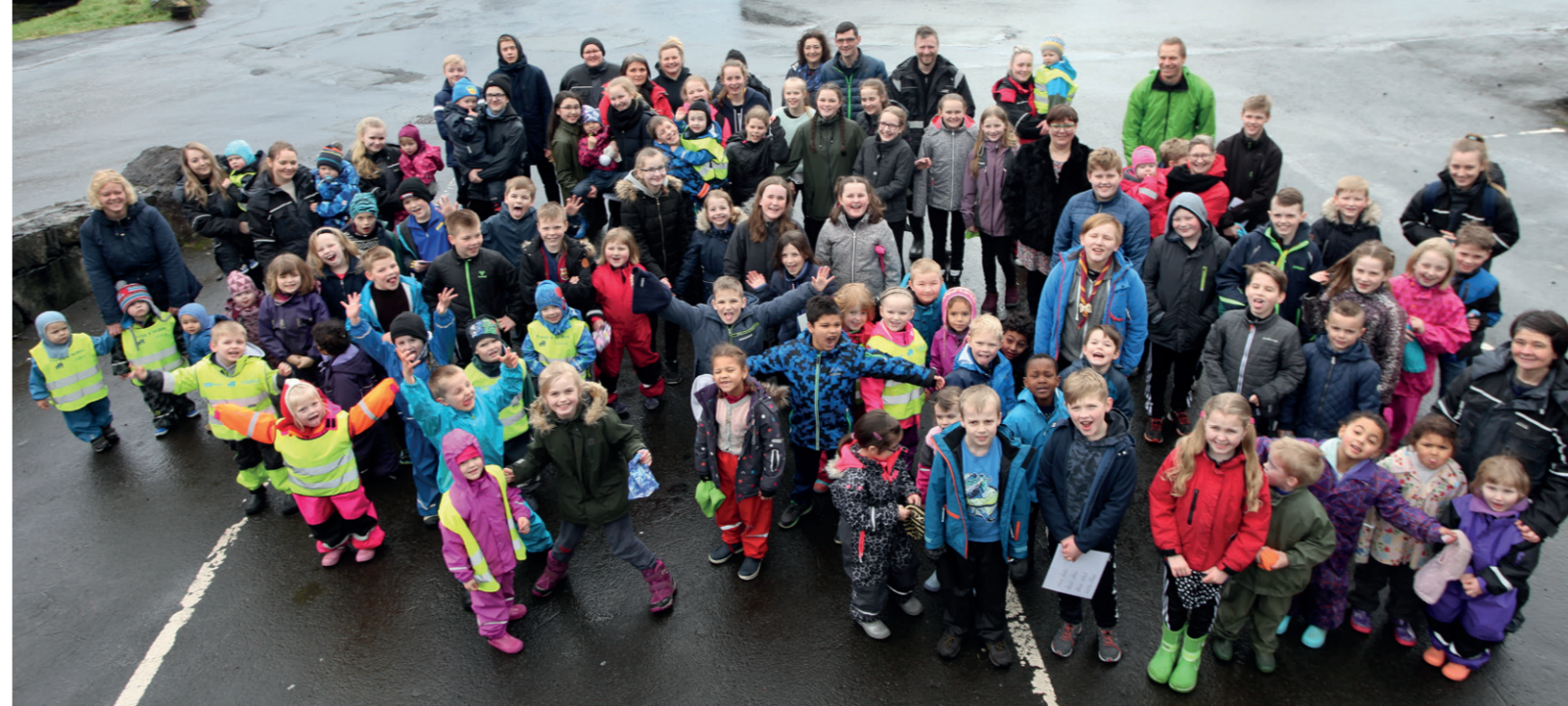
Kvívíkar kommuna saman við Dagstovninum og skúlanum í Kvívík skipa fyri felags tiltaki fyri at menna samstarvið millum stovnarnar og skapa góðar upplivingar hjá børnunum.

Við hesum fari eg at ynskja øllum borgarum á Skælingi, í Leynum, á Stykkinum, í Kvívík og á Válinum eini gleðilig jól og eitt eydnuberandi nýggjár.