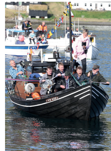
Snóruin til nýggja bátahylin á Válinum verður kliptur av núverandi borgarstjóra – her í báti saman við fyrrverandi borgarstjórum í kommununi.